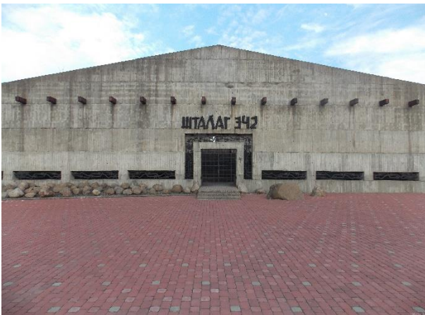
Мемориальный комплекс «Шталаг-342» расположен на ул. Замковая.